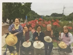
春日公園までドライブ