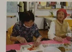
地域の方から頂いたいちごで ジャム作り